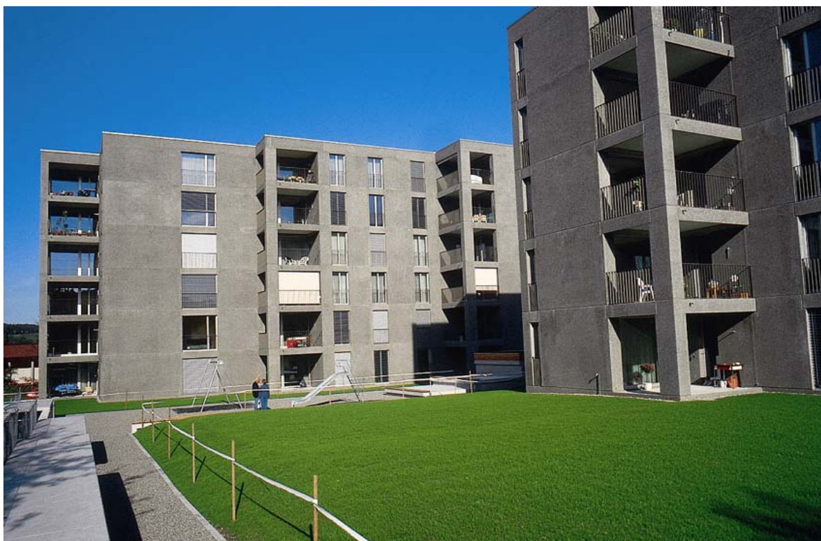
Eine Reportage über die Siedlung findet sich im „Wohnen“ Nr. 11/2002