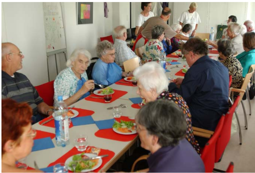
Mittagstisch in der BG Freiblick