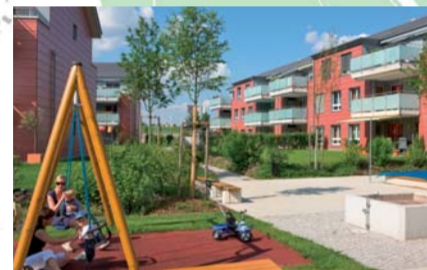
Tösswiesen Neftenbach, 2006. 12 Reihenhäuser und 36 Wohnungen mit Minergie, geheizt mit Abwärme der ARA