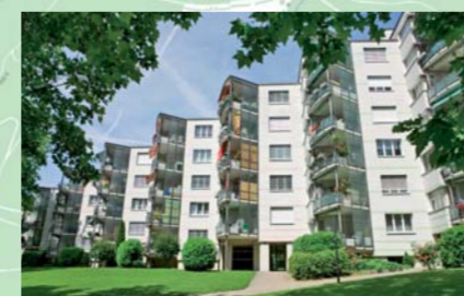
Siedlung Gutschick, 1967/68. 400 Wohnungen von vier Genossenschaften, Elementbauweise