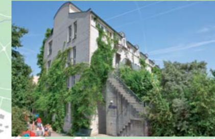
Sagi Hegi, 1992. 45 Wohnungen, selbstverwaltet