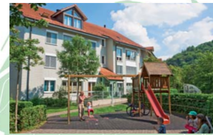
Wolfbühl, 1948, erneuert 1994. 26 Reihenhäuser und 180 Wohnungen, Quartiertreff

Auf diesem Stadtplan sind alle Häuser und Siedlungen rot eingefärbt, die einer Wohnbaugenossenschaft oder einer anderen gemeinnützigen Bauträgerschaft gehören – auch Bauten, die kurz vor der Realisierung stehen. Die Spalte rechts zeigt die vollständige Liste aller gemeinnützigen Bauträgerinnen mit Sitz im Bezirk Winterthur. Falls eine gemeinnützige Bauträgerin oder Siedlung fehlen sollte, bitten wir um Verzeihung und um Mitteilung an svw.winterthur@bluewin.ch .