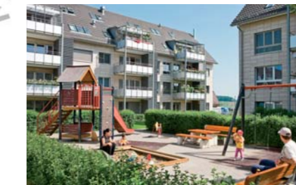
Siedlung Sulz, 2000. 24 Reihenhäuser und 56 Wohnungen, Fassade in Feinsteinzeug