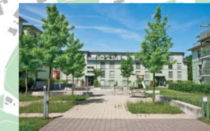
Siedlung im Gern Rümikon, 2003. 79 Wohnungen mit Minergie, Holzschnitzelheizung und Glasfassade