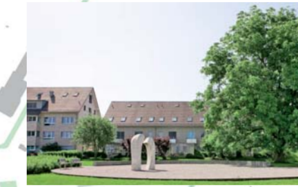
Marmor-Skulptur von Fredy Roth in der Siedlung Sulz