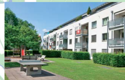
Siedlung Nägelsee, 1997. 26 Wohnungen im Grünen an der Töss