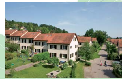
Siedlung Grabenacker, 1945/48, saniert 1968 und 2000. 117 Reihenhäuser und 30 Wohnungen, Quartiertreff