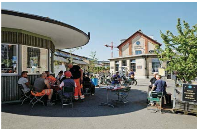
Zentrale Anlaufstelle des Lagerplatzes ist das Bistro «Portier», es ist Quartiertreffpunkt und Informationsdrehscheibe zugleich.

Ein überdachter Platz – eine ehemalige Kranbahn – wird vom Arealverein für regelmäßige Anlässe wie beispielsweise Nachtbazare genutzt.