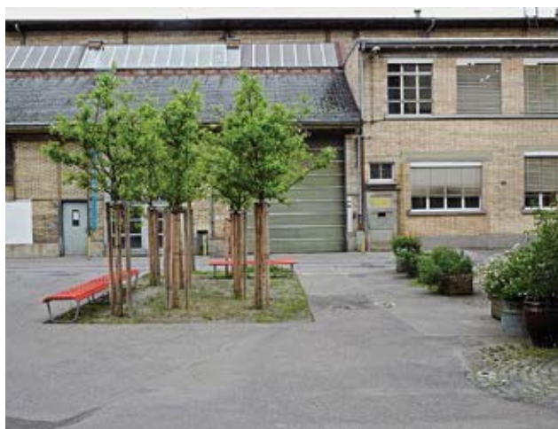
Bäume und Sitzgelegenheiten sorgen für weitere Auflockerung und Begegnungsmöglichkeiten.