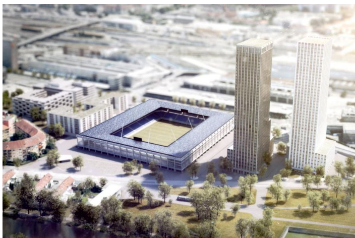
Das Projekt «Ensemble» konnte am meisten überzeugen. Links vom Fussballstadion ist der ABZ-Projektteil ersichtlich. (Visualisierung: HRS Real Estate AG).