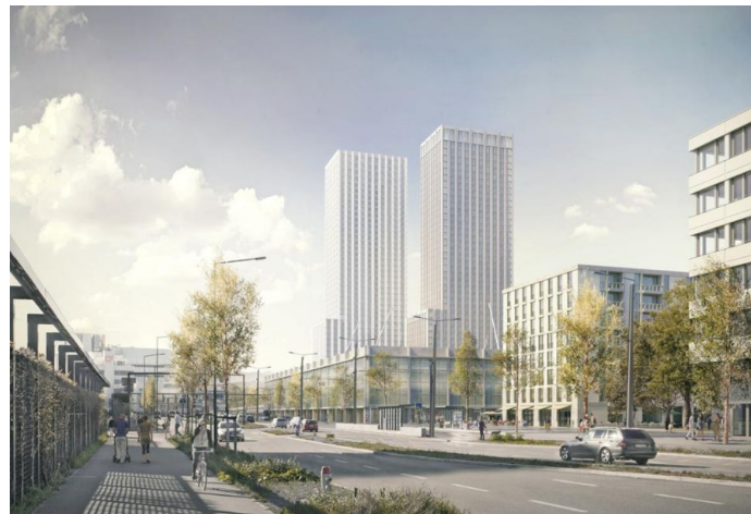
Ansicht des Projekts stadtauswärts. Im Vordergrund der beiden Wohntürme und des Stadions werden die Genossenschaftswohnungen entstehen. (Visualisierung: HRS Real Estate AG)

Das Projekt wird nun ein längeres Verfahren durchlaufen, mit dem heutigen Abschluss des Wettbewerbs wurde ein wichtiger Meilenstein erreicht. Bei der ABZ wird das Projekt in einem nächsten Schritt der Generalversammlung vorgelegt.