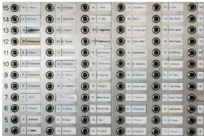
Preiswerte Wohnungen mit moderaten Flächenansprüchen: Klingelschild einer Siedlung in Zürich.

Die Wohnfläche pro Zürcher nimmt nicht mehr gross zu. Wegen der Genossenschaften.