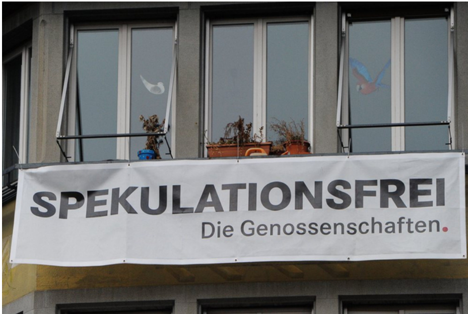
«Nicht an den Meistbietenden verschachern»: Anti-Spekulations-Plakat in Zürich. (Januar 2013)

Die Zuwanderungsinitiative wird nicht verhindern, dass die Wohnungsnot in den Zentren noch weiter zunimmt: Dies besagt eine von der SP in Auftrag gegebene Studie.