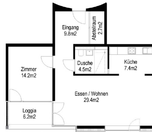
2.5 Zimmerwohnung 68 m 2