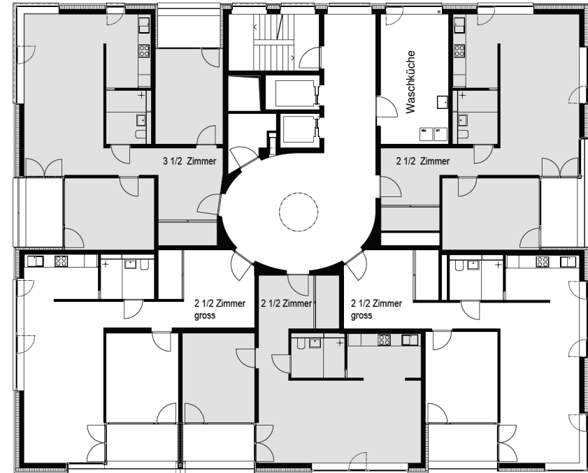
Regelgeschoss mit Waschküche (2. 6. 10. OG)