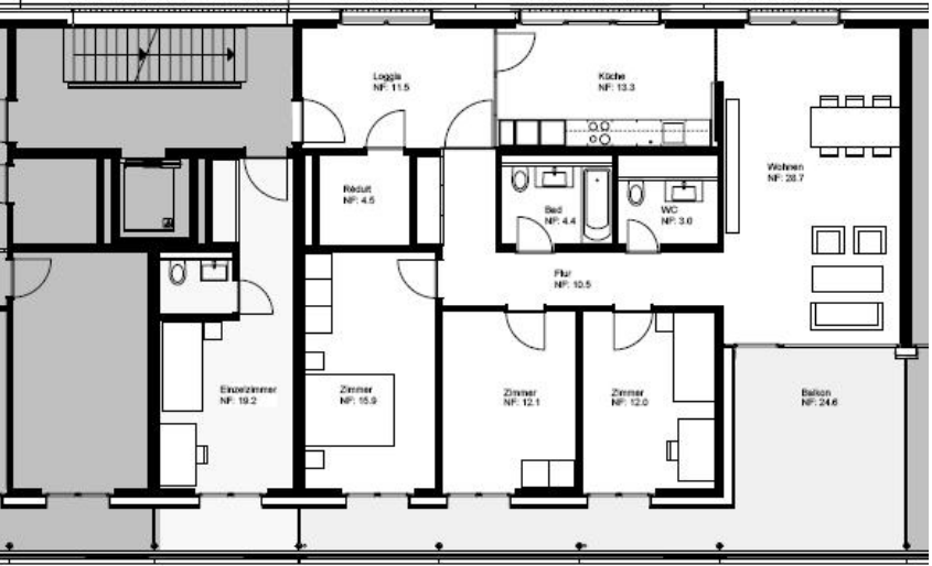
Separat-Zimmer 5.5.-Zimmerwohnung Haus Brunnenhofstrasse