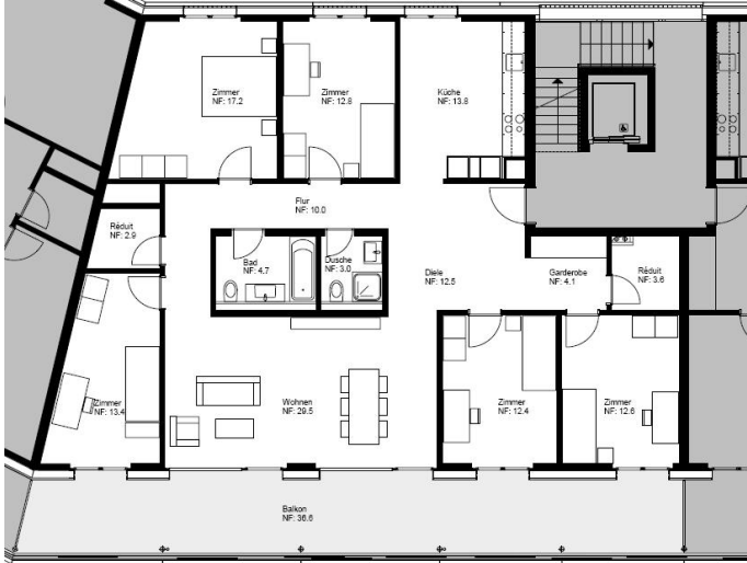
6.5-Zimmerwohnung Haus Brunnenhofstrasse