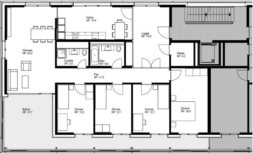
5.5-Zimmerwohnung Haus Hofwiesenstrasse