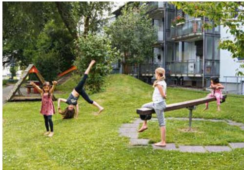
Um den Kontakt unter den Bewohnerinnen und Bewohnern zu stärken, braucht es niederschwellige Treffpunkte, wie ein Spielplatz.

Genossenschaften können den gelebten Alltag auch mit ihrer Wohnungsvergabepolitik steuern: Je nachdem, an wen sie eine Wohnung abgeben, entscheiden sie über die Zusammensetzung der Bewohnerinnen und Bewohner hinsichtlich Alter, Nationalität usw. und beeinflussen damit die Nachbarschaft. Gemäss dem Forschungsteam der Hochschule Luzern