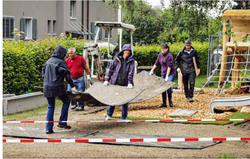
Gemeinsam planen und ausführen: Die Bewohnerinnen und Bewohner sollten bei der Gestaltung des Aussenraums mitreden können.