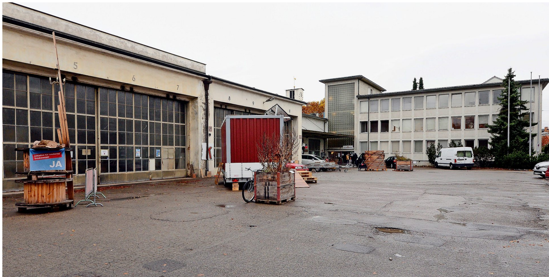
Ein Teil der Hallen und das Verwaltungsgebäude (rechts) bleiben stehen. Sonst wird beim Areal Depot Deutweg alles abgerissen.

Busdepot Deutweg Neben Wohnungen plant die Zürcher Architekturfirma in den Bushallen Gewerberäume, in denen auch das Quartier zusammenkommen soll.